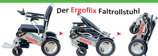
Der Ergoflix Faltrittstuhl

2 starke Elektromotoren, schaffen mühelos Steigungen bis 12 °. Für eine neue Mobilität... Holen Sie sich ein Stück Unabhängigkeit zurück. Platzsparend klappbar. Verordnungsfähig.